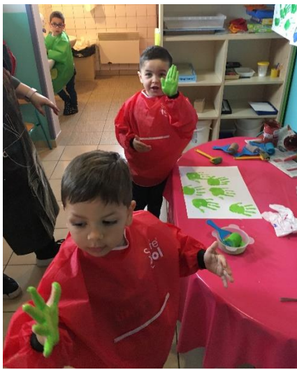
Peindre 100 empreintes de mains