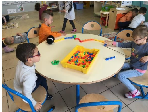
Dix paquets de dix perles pour un beau collier de 100 perles !