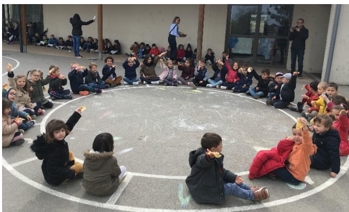
Nous avons terminé notre journée par une dégustation de crêpes offertes par la classe des MS/GS, qui avaient fait un peu plus de 100 crêpes !