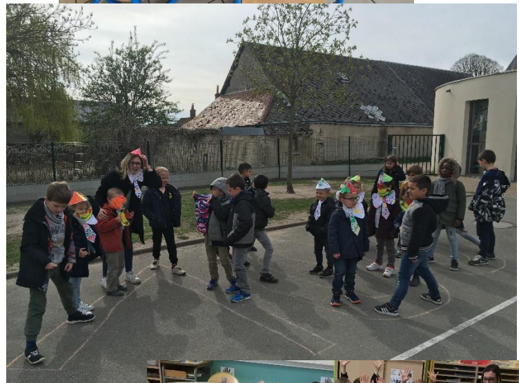
100 accessoires de clowns pour retrouver tous les enfants de l'école et danser ensemble dans la cour !