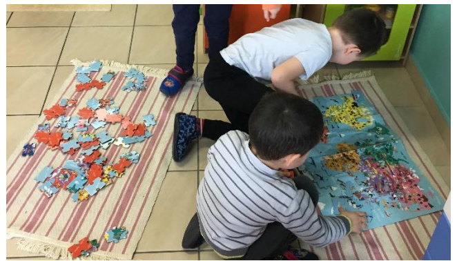
Un puzzle de 100 pièces. Merci aux CP-CE1 qui nous ont aidés !