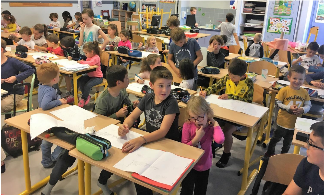
Équipes en binôme : un CM1 ou un CM2 avec un petit ou un moyen.