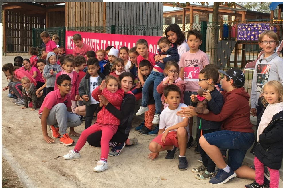
Chacun à son rythme !