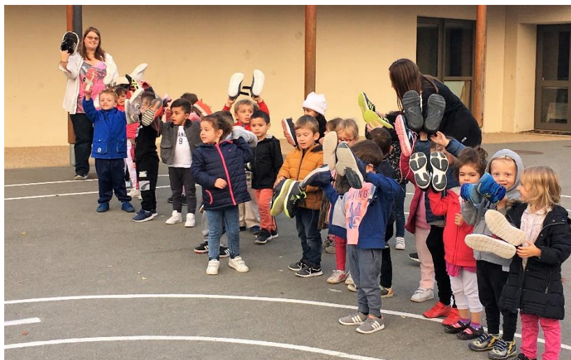
Les PS et MS, prêts à courir pour apporter les chaussures des grands.