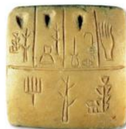
Tablette en pierre calcaire, découverte en Mésopotamie

Au départ, les hommes écrivaient avec des signes. Chaque mot était représenté par un signe. Pour écrire, il fallait donc en connaître des milliers !