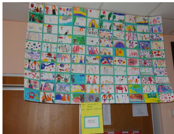
Les MS/GS avec leur sculpture de 100 bouteilles et leurs 100 dessins