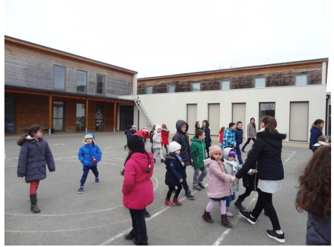
Les 100 pas dans la cour