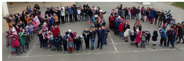
Tous dans la cour !!!

Voici comment a été vécu le 100 ème jour d'école par les élèves. (Petits textes écrits soit pendant un temps libre de classe soit en APC en utilisant le traitement de texte informatique.)