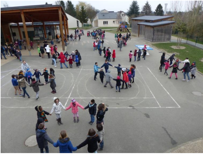
Les 10 rondes de 10 élèves et les farandoles

Lucas : « Pour le 100 ème jour d'école, tout m'a plu ! Par exemple, le monstre aux 100 yeux , le gâteau... il était délicieux ! La musique aussi était jolie quand on a dansé en 10 rondes et farandoles . »