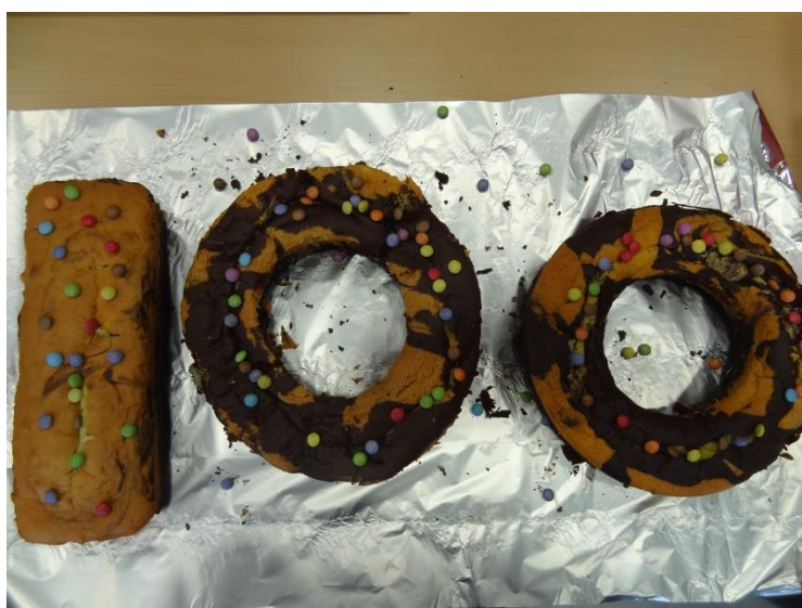
... et voici le résultat !!!