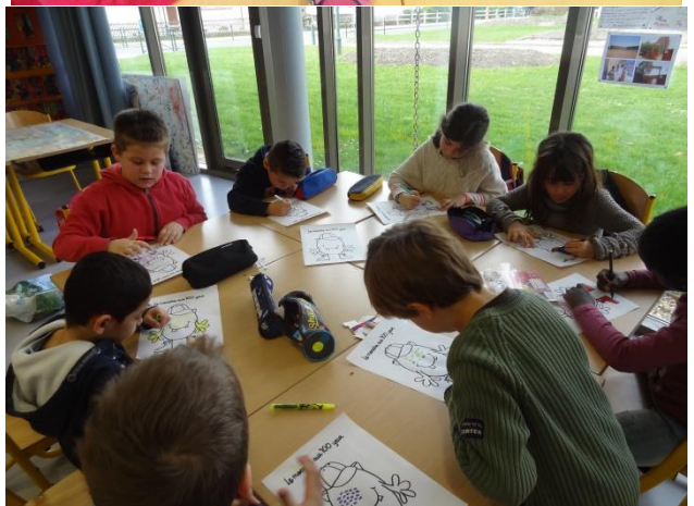
Le monstre aux 100 yeux !