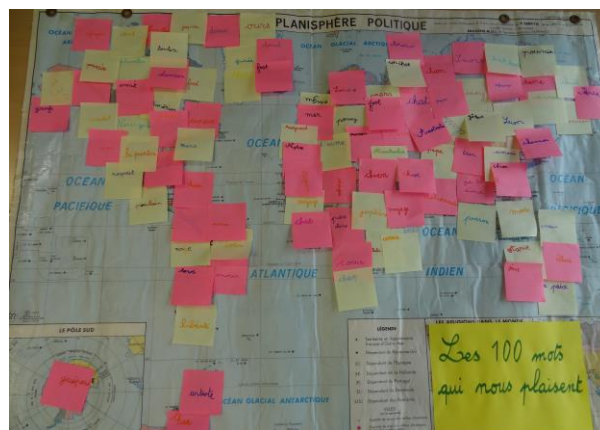
100 mots qui nous plaisent

Antonin : « Mardi 1 er mars, j'ai aimé quand on a fait un gâteau de 100 . J'ai adoré quand Mme Maison était sur le toit pour prendre une photo où on était en position de 100 . Puis j'ai aimé quand on a écrit les mots qui nous plaisaient sur des post-it. »