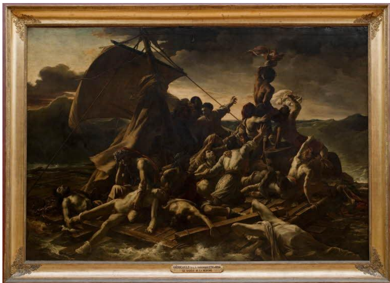
Le radeau de la Méduse (réalisé par GERICAULT)