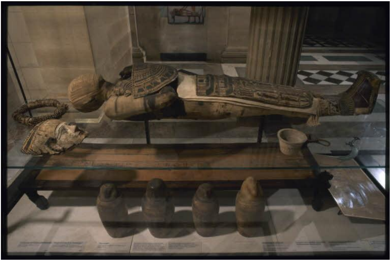
Momie d'un homme