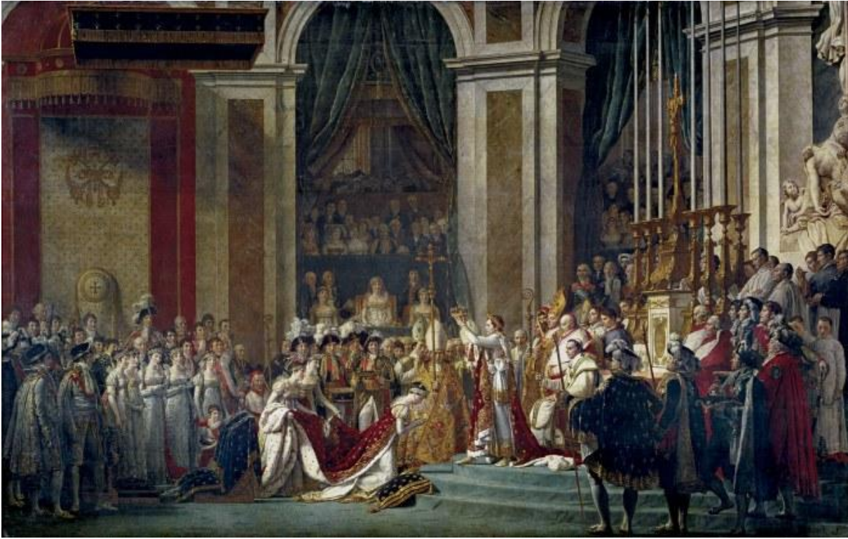
Le Sacre de Napoléon 1 er (réalisé par David)