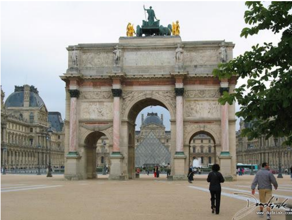
L'arc de Triomphe Carrousel (à ne pas confondre avec l'Arc de Triomphe des Champs-Élysées).