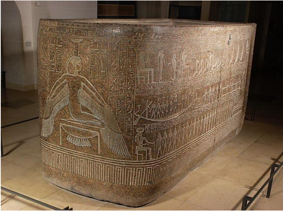
Cuve du Sarcophage du pharaon Ramsès 3