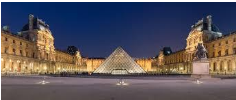
Le Louvre et sa pyramide