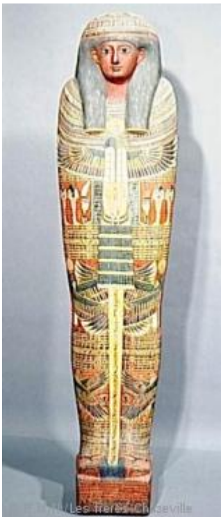
Couvercle d'un cercueil