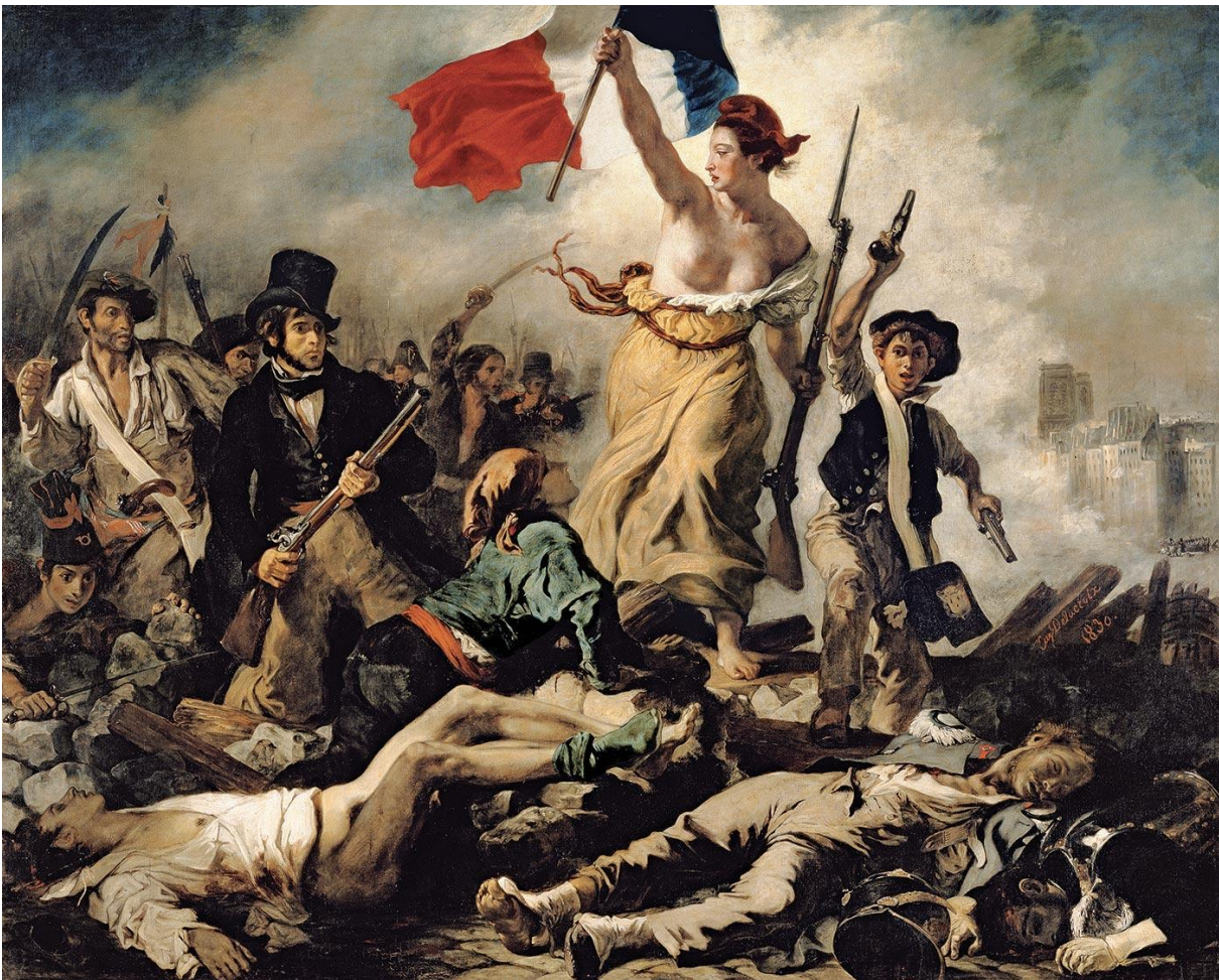
La Liberté guidant le peuple (réalisée par Eugène Delacroix)