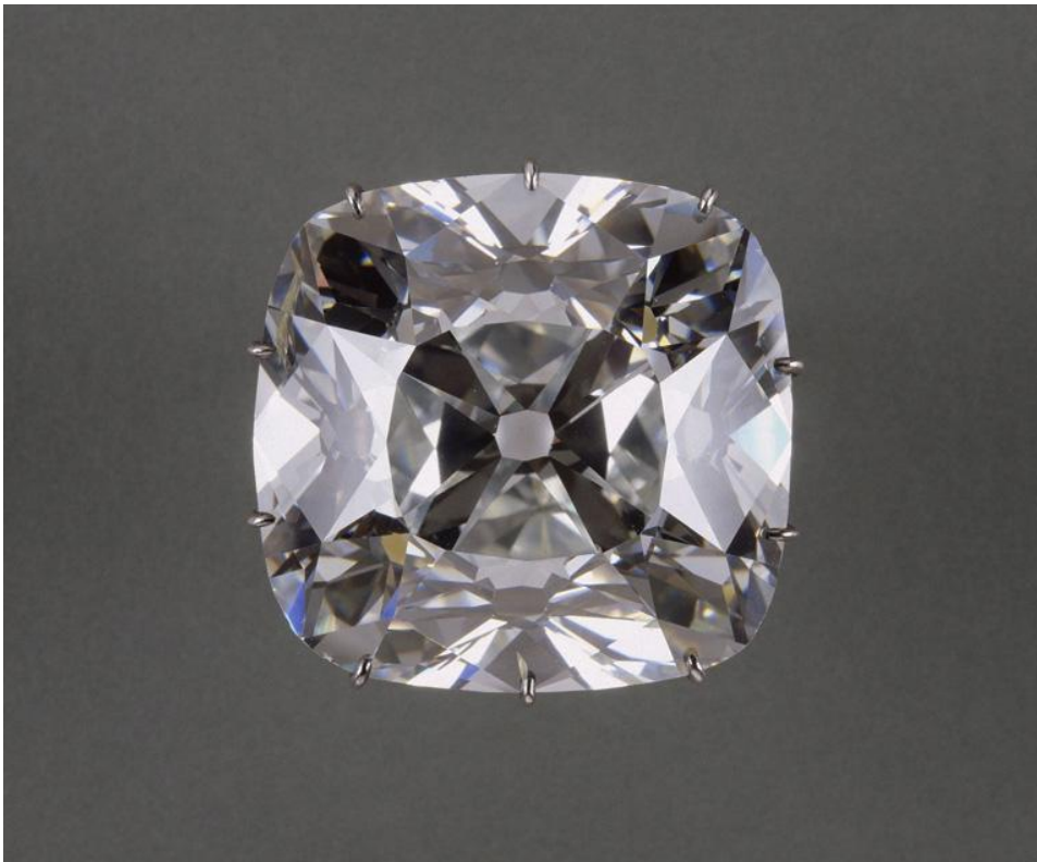
Le Régent , diamant considéré comme le plus beau du monde ! Il fut porté par plusieurs rois de France.