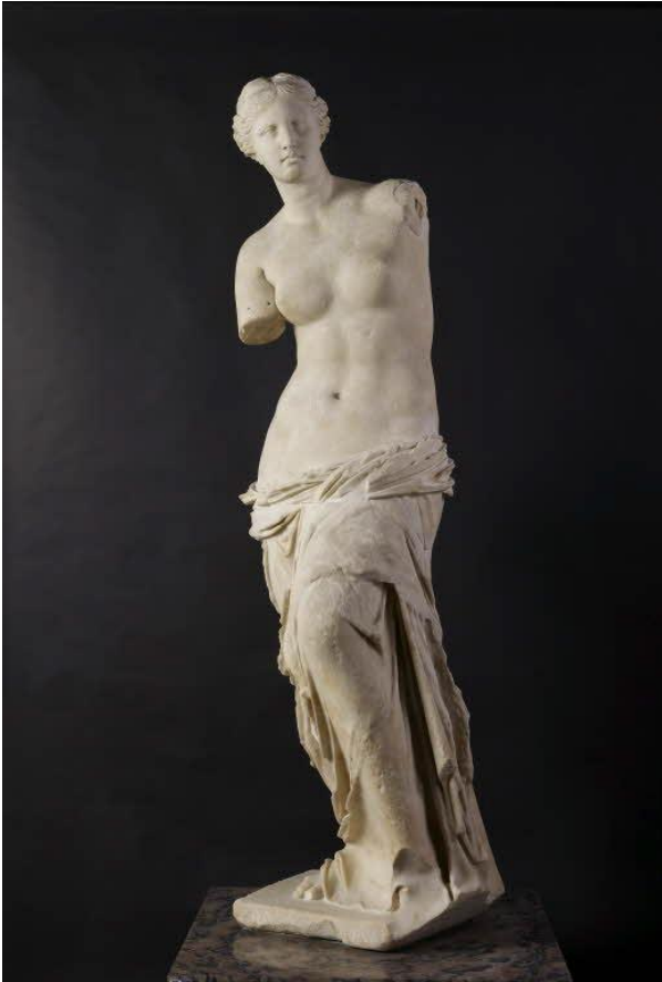
La Vénus de Milo