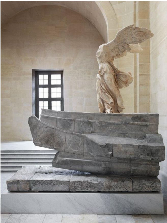
Victoire de Samothrace