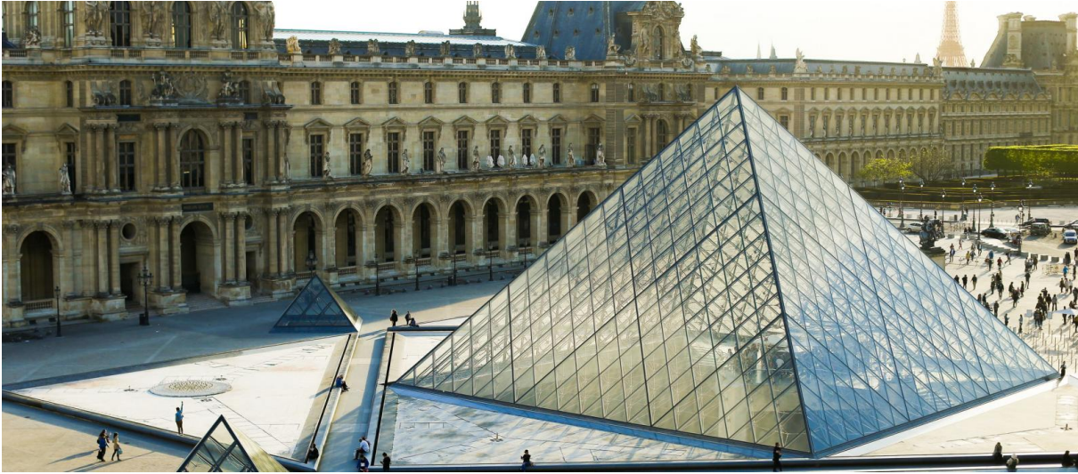
La pyramide du Louvre