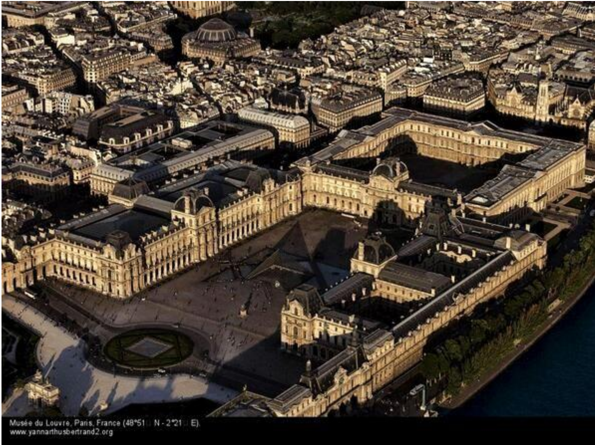
Le Louvre vu du ciel

Le Louvre est un des plus célèbre musée du monde. Il se situe à Paris.