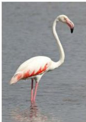
LE FLAMANT ROSE