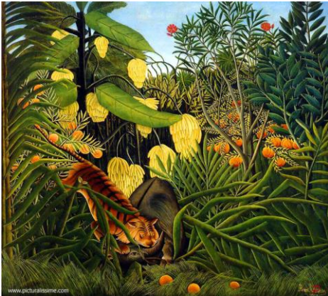
Combat du tigre et du buffle, 1908