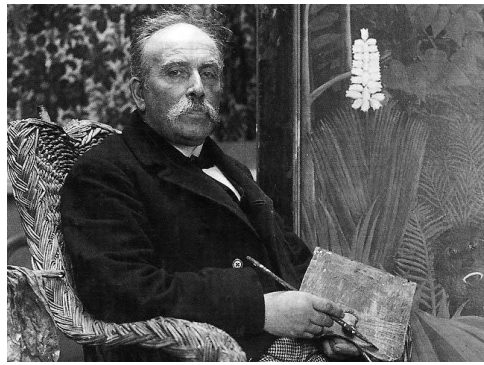
Le Douanier Rousseau, peintre français (1844-1910)

Le Douanier Rousseau peint essentiellement des paysages exotiques, alors qu'il n'a presque jamais quitté Paris. Les animaux peints sont ceux qu'il voyait au zoo du jardin d'acclimatation de Paris. On retrouve une flore exubérante et parfois inventée sur ses tableaux.