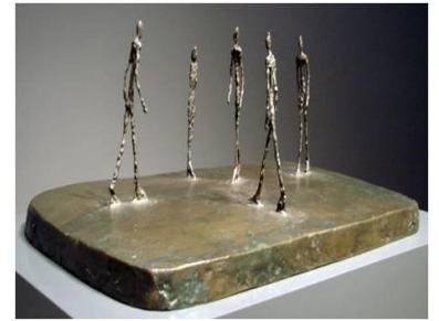
La place, 1948